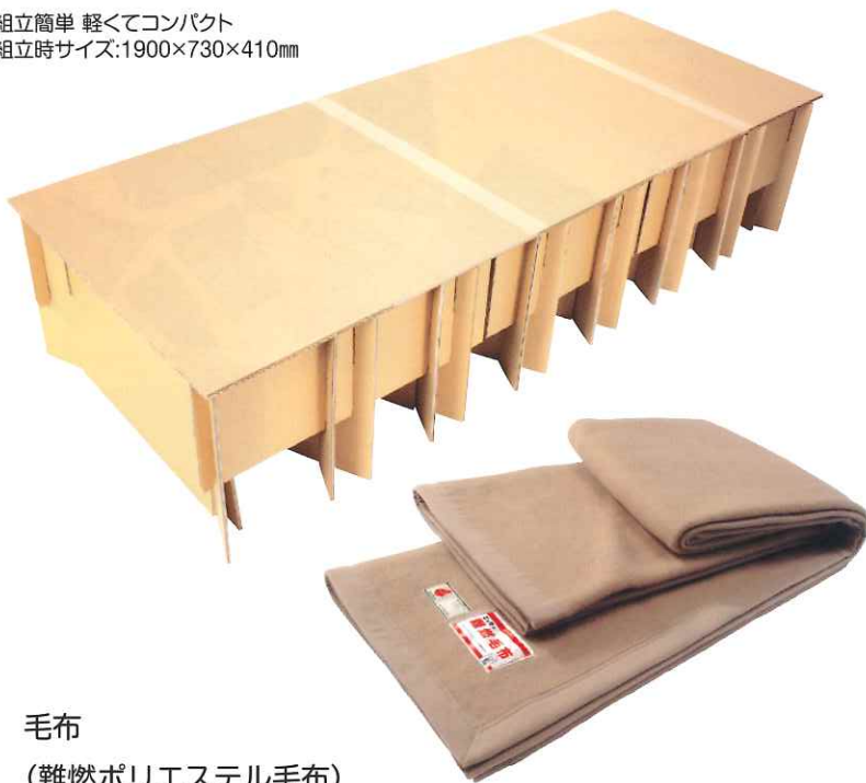
毛布 (難燃ポリエステル毛布)