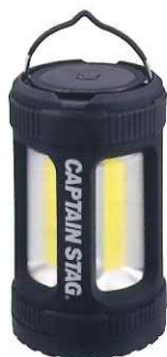
ランタン 明るさは4段階。

避難所の体育館や公民館など寒さの厳しい場所に 適しています。 「V-Lap®」不織布はかさ高軽量、反発性、耐久性、 通気性等、クッション材として非常に優れています。